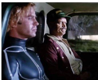
1992 LE COBAYE (The Lawnmower Man) de Brett Leonard avec Jeff Fahey