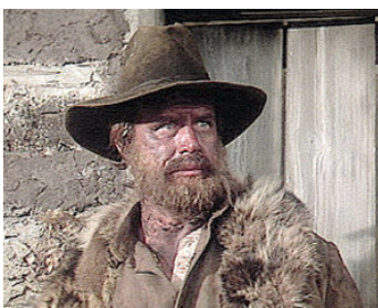
1980 LA PORTE DU PARADIS (Heaven's Gate) de Michael Cimino