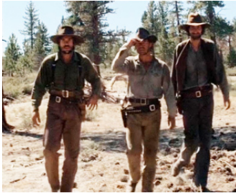
1973 L'HOMME DES HAUTES PLAINES (High Plains Drifter) de C. Eastwood avec A. James, Dan Vadis