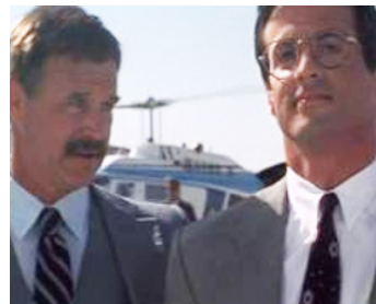
1989 TANGO ET CASH (Tango & Cash) d'Andrei Konchalovski avec Sylvester Stallone