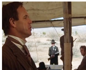
1980 TOM HORN (Tom Horn) de William Wiard avec Steve McQueen