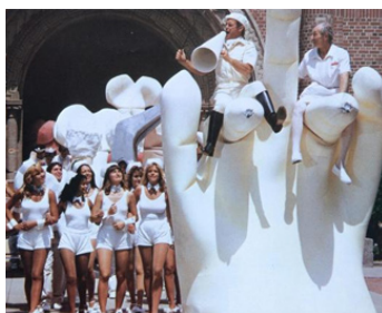
1985 TOUBIB ACADEMY NUMÉRO UN (Stitches) de Rod Holcomb (Alan Smithee)