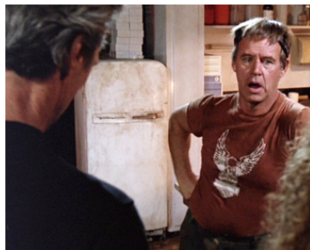
1989 PINK CADILLAC (Pink Cadillac) de Buddy Van Horn avec Clint Eastwood