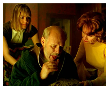
2010 MISS NOBODY (Miss Nobody) d'Abram Cox avec Leslie Bibb, Kathy Baker