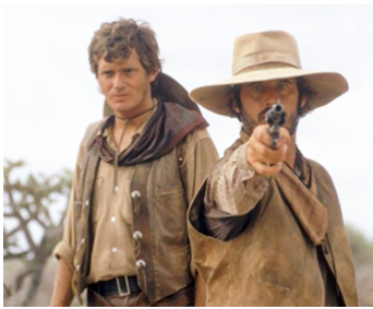
1972 LA POUSSIÈRE, LA SUEUR ET LA POUDRE de Dick Richards avec Bob Hopkins