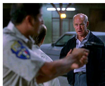
2000 WAY OF THE GUN (Way of the Gun) de Christopher McQuarrie