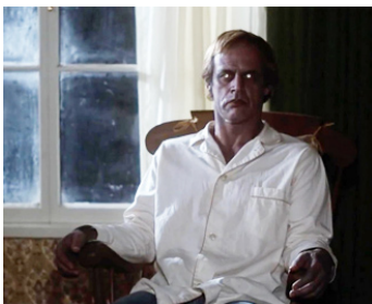
1979 LES VAMPIRES DE SALEM (Salem's Lot) de Tobe Hooper