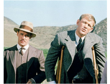
1975 LA KERMESSSE DES AIGLES (The Great Waldo Pepper) de G. Roy Hill avec Bo Svenson