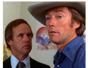
1980 BRONCO BILLY (Bronco Billy) de Clint Eastwood avec Clint Eastwood