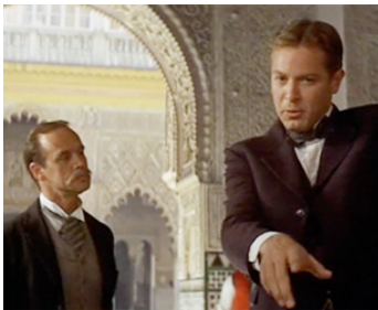
1975 LE LION ET LE VENT (The Wind and the Lion) de John Milius avec Darrell Fetty