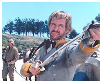
1982 LES CAVALIERS DE L'OMBRE (The Shadow Riders) d'Andrew V. McLaglen