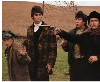
1972 LES REBELLES VIENNENT DE L'ENFER (Bad Company) de R. Benton avec Barry Brown