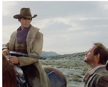
1978 SELLE D'ARGENT (Sella d'argento) de Lucio Fulci avec Giuliano Gemma