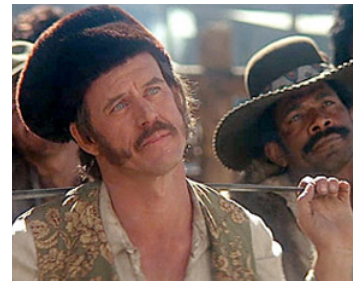
1976 LA REVANCHE D'UN HOMME NOMMÉ CHEVAL d'Irvin Kershner