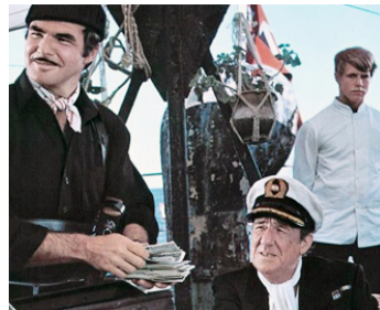
1975 LES AVENTURIERS DU LUCKY LADY de S. Donen avec Burt Reynolds, M. Hordern