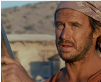
1978 SHOOT THE SUN DOWN (Shoot the Sun down) de David Leeds