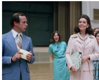
1975 SMILE (Smile) de Michael Ritchie avec Barbara Feldon