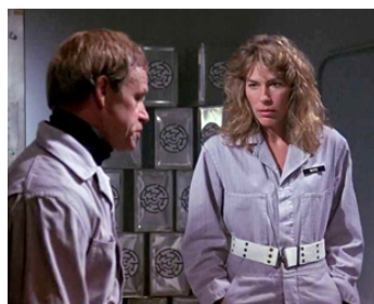
1984 LA NUIT DE LA COMÈTE (Night of the Comet) de Thom Eberhardt avec Mary Woronov