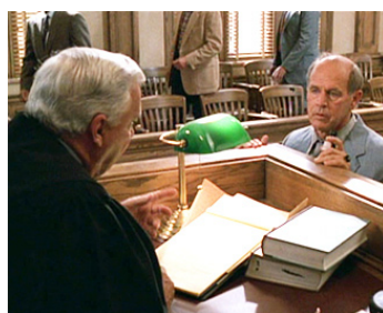
1997 MINUIT DANS LE JARDIN DU BIEN ET DU MAL de Clint Eastwood avec Sonny Seiler