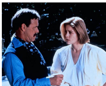
1990 DÉLIRIUM (Disturbed) de Charles Winkler avec Pamela Gidley