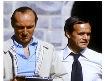
1979 COMME UN HOMME LIBRE (The Jericho Mile) de Michael Mann avec Ed Lauter