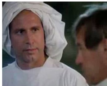
1989 AUTANT EN EMPORTE FLETCH (Fletch Lives) de Michael Ritchie avec Chevy Chase