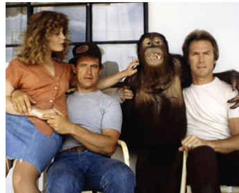
1978 DOUX, DUR ET DINGUE (Every which way but loose) de J. Fargo avec B. D'Angelo, C. Eastwood