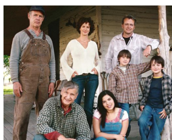
2004 PLAINSONG (Plainsong) de Richard Pearce avec Rachel Griffiths, Aidan Quinn