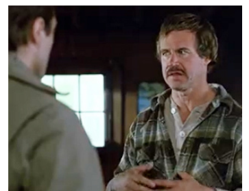
1982 J'AURAI TA PEAU (I, the Jury) de Richard T. Heffron avec Armand Assante