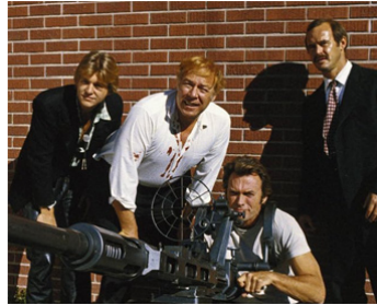
1974 LE CANARDEUR (Thunderbolt and Lightfoot) de M. Cimino avec Jeff Bridges, C. Eastwood