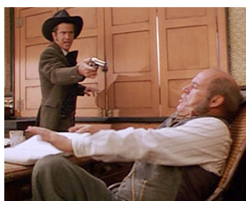
1994 MAVERICK (Maverick) de Richard Donner avec Mel Gibson