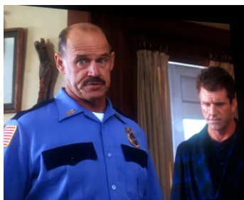
1993 L'HOMME SANS VISAGE (The Man without Face) de Mel Gibson avec Mel Gibson