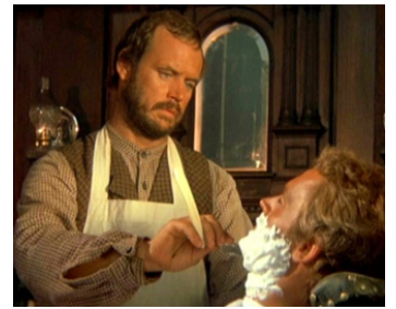
1973 MON NOM EST PERSONNE (Il mio nome è Nessuno) de Tonino Valerii avec Terence Hill