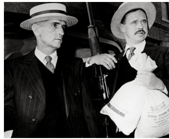
1973 DILLINGER (Dillinger) de John Milius avec Harry Dean Stanton