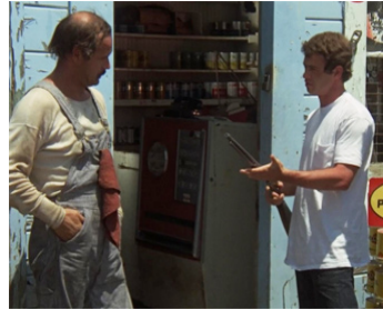
1974 MACON COUNTY LINE de Richard Compton avec Alan Vint