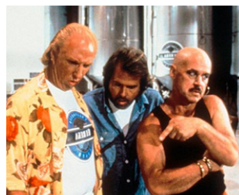
1992 WISHMAN (Wishman) de Brett Leonard avec Brion James, Paul Le Mat