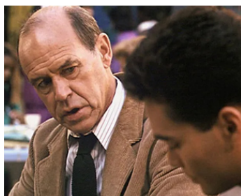
1993 LA LOI DU PLUS FORT (Only the Strong) de Sheldon Lettich avec Mark Dacascos