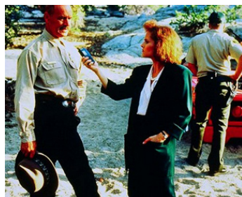
1993 AU-DESSUS DE LA LOI (Joshua Tree) de Vic Armstrong avec Mary Ingersoll